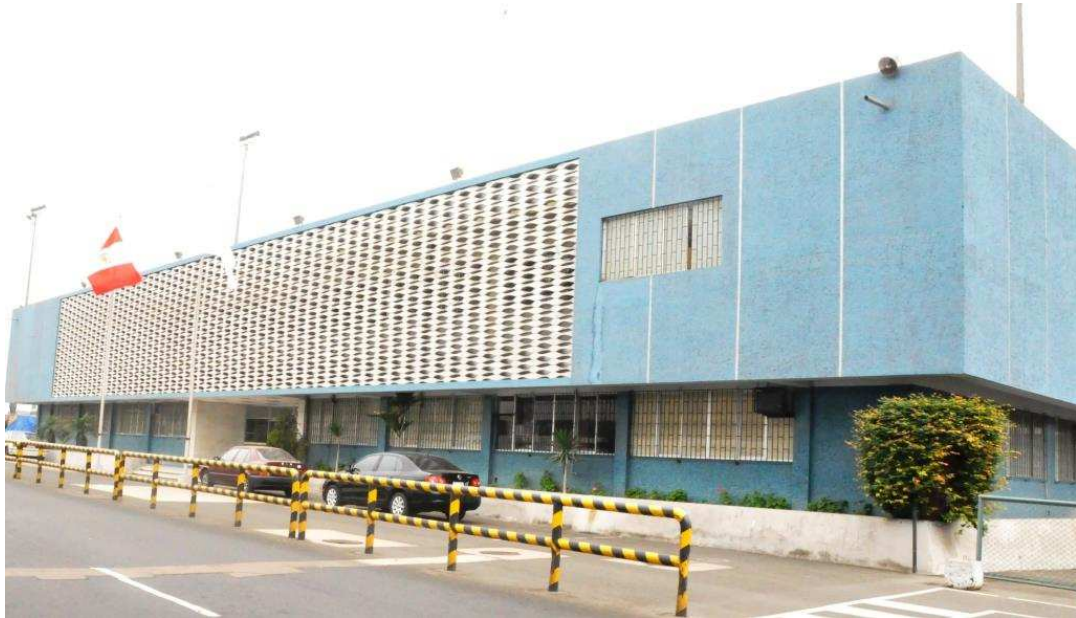
Frontis del Centro de Instrucción de Aviación Civil (CIAC) de CORPAC S.A. ALMA MATER de los Controladores de Tránsito Aéreo del Perú